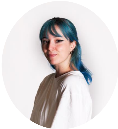
María Calvo Diseño gráfico y web