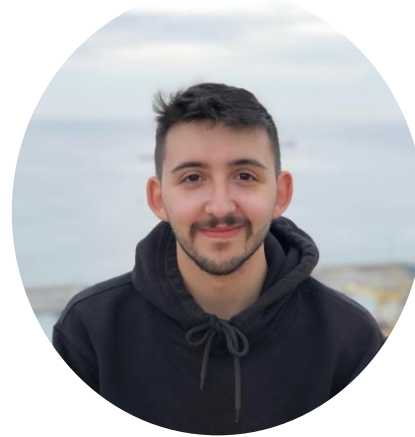
Víctor Martín Diseño gráfico y web