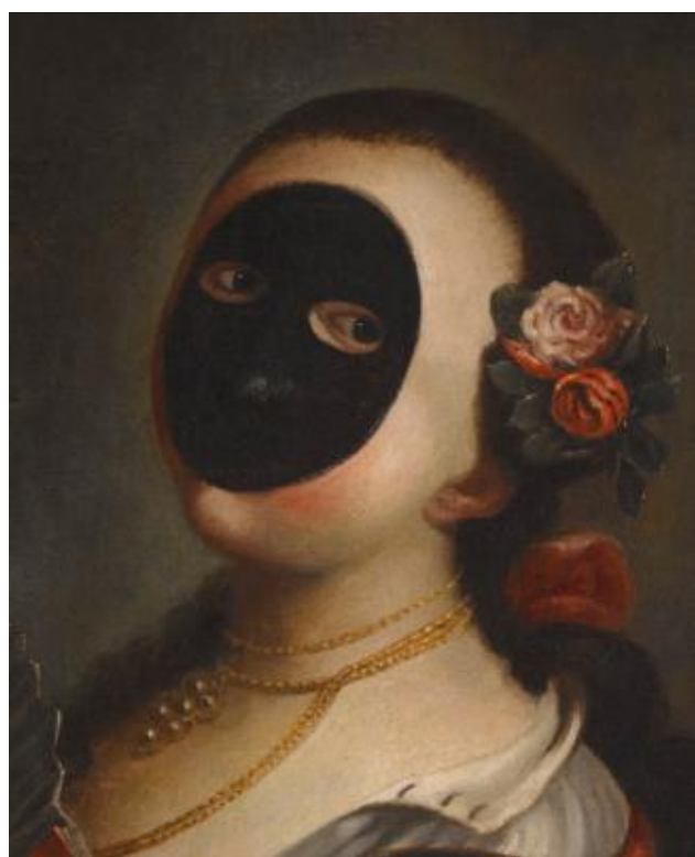
Detalle de La Moretta , Felipe Boscaratti. 1790.