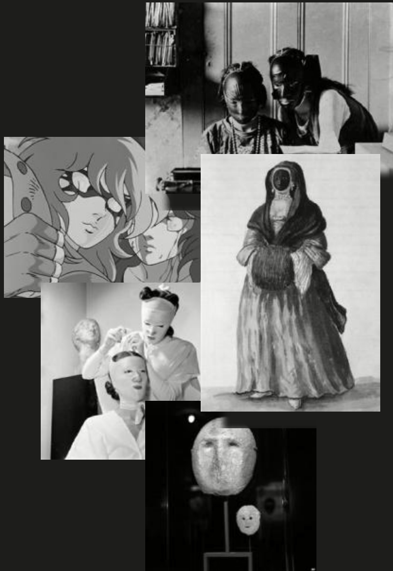
Marin y Shaina, Caballeros del Zodíaco, 1986 Máscaras de belleza, S/D Tratamiento de belleza en el salón de Helena Rubinstein, c. 1940 Moretta, Giovanni Grevembroch, c. s. XVIII Colección de las máscaras más antiguas encontradas, 7000 a.n.e.